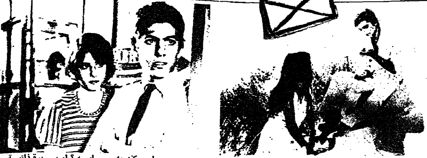
عاد الابن الضال ولم يعد يوسف

قالوا : وهل نحن - حقل تجارب - ايها الاحق قال : او لم يبتلى الاببياء من قبل ويختبروا .. لقد ابتلى الله آدم و ابراهيم ويونس وابسوب وغيرهم كثير فاصبروا وصابروا يا عقلاء القرن الضليل !!!